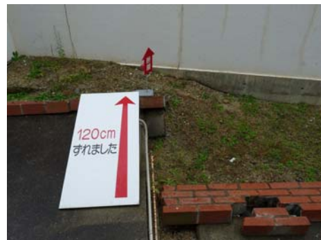
震災後の地盤ずれ