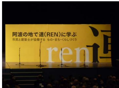
たくさん学んできました。