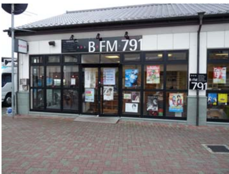
すぐ横にはラジオ局もあり