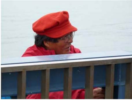
会場外ではこんな人や