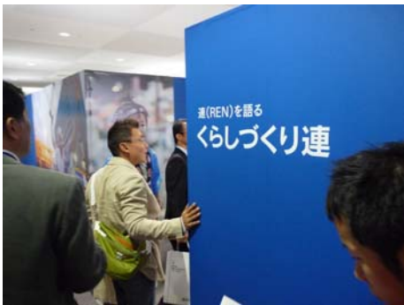
れん (REN) に学ぶブースで