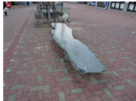
一枚ものの石のベンチがあり